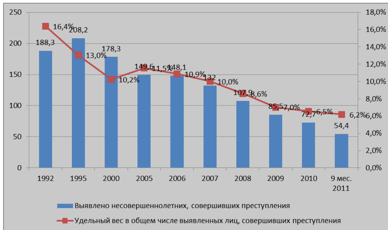
Рис. 1. Динамика преступности несовершеннолетних, тыс. лиц.

В пиковый 1995 год было выявлено 208,2 тыс. несовершеннолетних преступников, в 2005 г. – 149,6 тыс. а в 2010 г. – 72,7 тыс. 4 Указанное снижение произошло на фоне снижения общего количества выявленных лиц, совершивших преступления в России за последние четыре года (2007 г. – 1318 тыс., 2008 г. - 1256, 2009 г. – 1220, 2010 – 1111 тыс.). Динамика последнего 2011 года позволяет говорить об устойчивости этой тенденции. Так за 9 месяцев 2011 года выявлено 54,4 тысячи несовершеннолетних преступников, что составило 6,2% от общего количества выявленных преступников, тогда как годом раньше удельный вес несовершеннолетних преступников составлял 6,5% 5 .